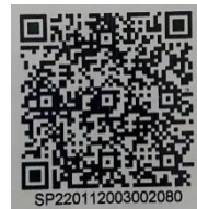
图 1 扫码